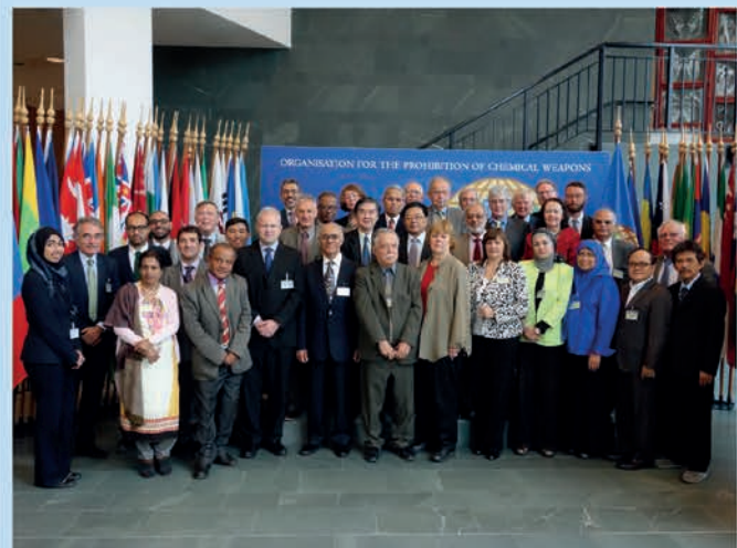
第二次关于化学武器公约的实践伦理指导方针研讨会的参与者。